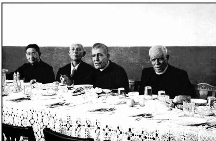
Mis maestros (1955)