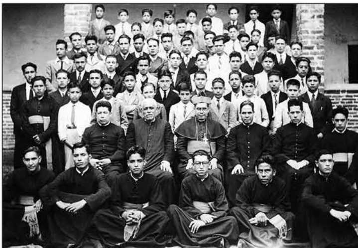
Seminario de Tacámbaro, Curso 1943-1944

“De momento lo que más me preocupa es la escasez de sacerdotes. Por eso estoy empeñado en que se atienda el Seminario”.